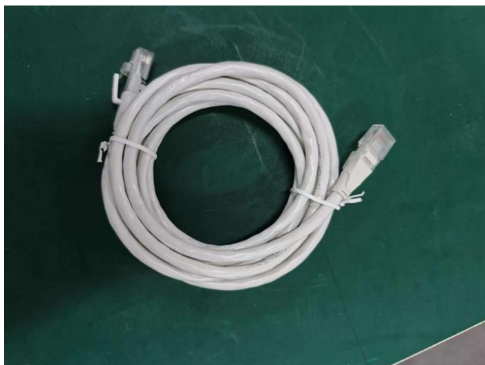
图 2 网线图