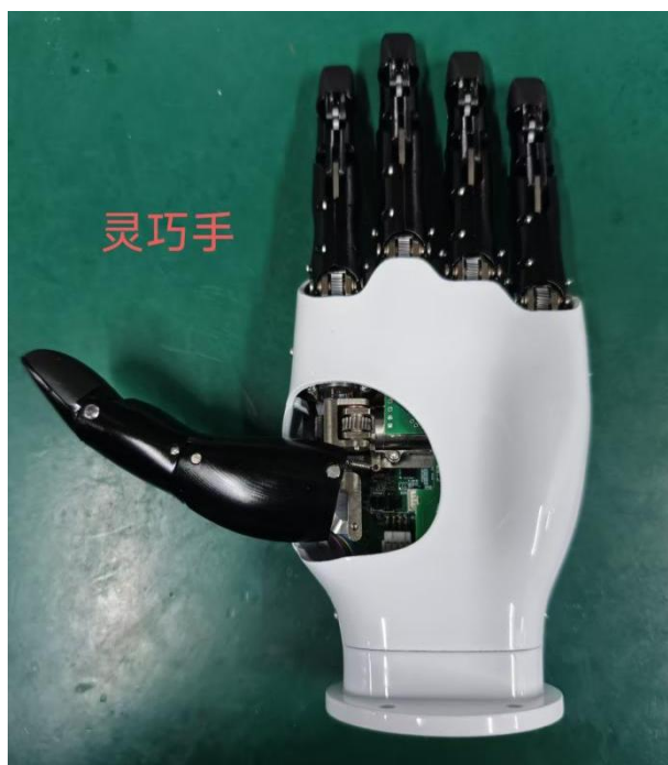
图 1 灵巧手图